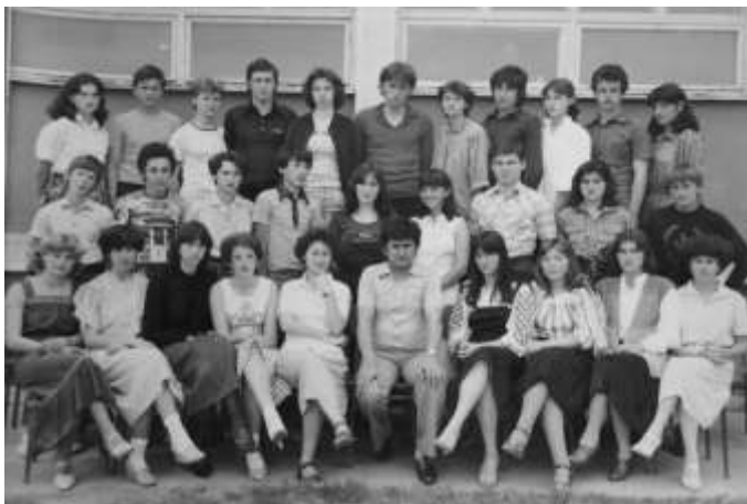
Моје одељење, мај 1979. године. У првом разреду средње школе, на Педагошкој академији.

Свако време има својих предности али и мана. Овај 21. век је пружио велике могућности за образовање, пре свега преко коришћења рачунара и интернета и то је изузетан напредак за човечанство. Друга је ствар, што се то, рекао бих за већину по мом мишљењу, користи за разбригу а не за образовање и усавршавање. Један велики мудрац је рекао: „Добра организација времена је пола успеха“. Време од пре 30-ак година је било спорије тако да се имало времена за много тога. Време смо користили за шетњу, спорт у школском дворишту, дружење, разговор. Породица је била блискија, није било таквог отуђења као данас. Данас много мање има бављења спортом, отуда и крива кичма код једног броја младих. Такође, лошија исхрана кроз брзу храну повлачи слабљење имунитета и више болести. То је цена брзог живота.