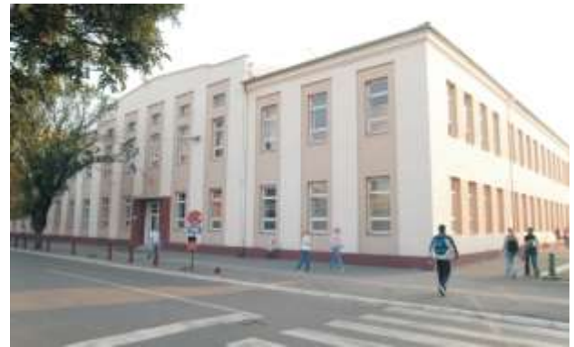
Од 1990. год. назив Гимназија у Ћуприји

Коначно, са школском 1990/1991. годином школа је уписала у први разред четири одељења гимназије општег смера. Од тада школа ради под именом Гимназија у Ћуприји . Овај назив школе остаће до данас. Почетком деведесетих година прошлог века престала је прослава Дана школе 25. маја и у наредних неколико година прославе није било. У школској 1994/1995. години почело се са припремама за обележавање прославе 85 година од почетка рада Гимназије. Тада је одлучено да се за обележавање узме датум 16. април, с обзиром да је тог датума, далеке 1909. године, стигао Указ да се може у Ћуприји отворити Гимназија. До данас, овај датум се обележава као Дан школе .