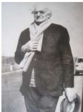
Душан Матић, академик

За своје вековно постојање, Ћупријска Гимназија је изнедрила велики број успешних ученика. У даљем школовању, многи од њих ће достићи врхунац у својим професијама и они ће бити многобројни професори факултета и школа, генерали, доктори наука, лекари, економисти, врхунски спортисти, али пре свега добри људи. Ово су неки од њих.