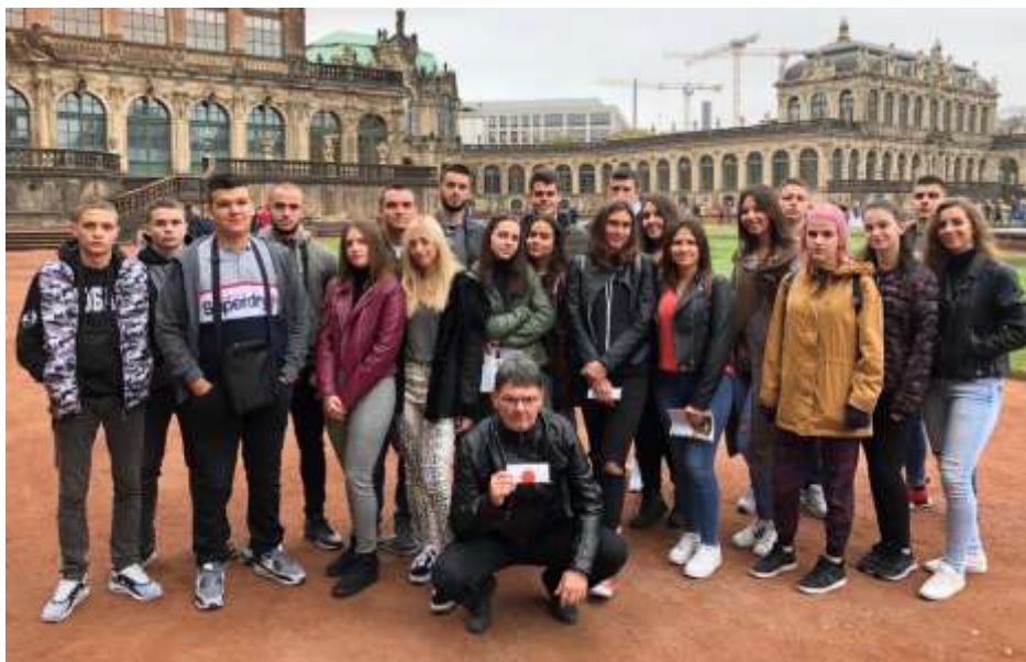
Незаборавни тренуци, са екскурзије Праг-Дрезден-Братислава

„Опраштамо се, опраштамо се и страшно дугим ногама одлазимо у свет...“ Још једна генерација, још један растајак, још једне дивне четири године које су прошле као трен. Још хиљаде вредних и јединствених тренутака, осмеха, суза, тајни и љубави које остају дубоко урезане у нашим срцима