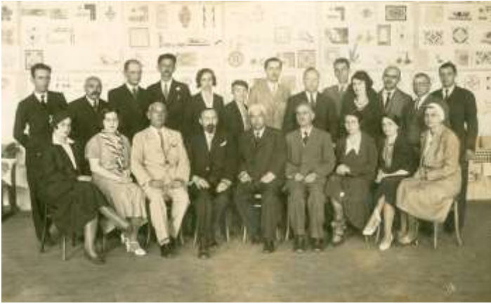
Професорски колегијум у школској 1932/1933.