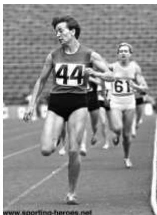
Вера Николић, светска рекордерка