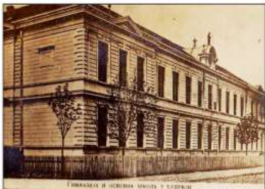
1909. Једна од 11 приватних гимназија

С обзиром да Гимназија тада није имала своју зграду, настава се изводила у северном крилу Основне школе „Ђура Јакшић“, на спрату. У овој згради изводиће се настава за