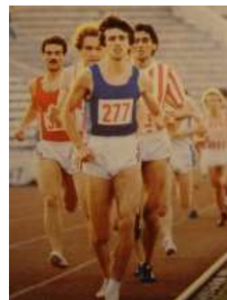
Драган Здравковић, европски првак