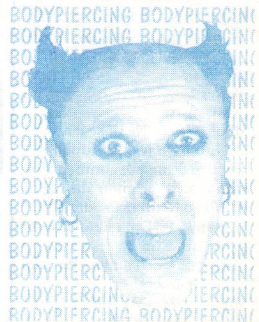
Keith Flint - Prodigy