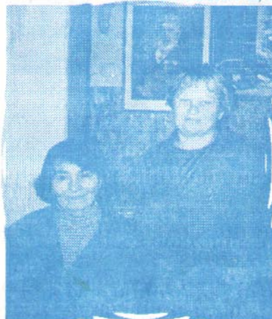
TETKA SLAVNA I NJENA DRUGARICA

NIJE ONA SLAVNA ZATO ŠTO JE SLAVNA. NEGO JE ONA SLAVNA ZATO ŠTO SE TAKO ZOVE. (teh. ur.)